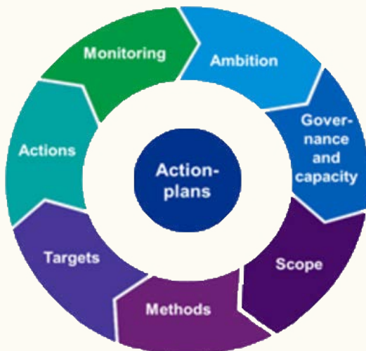
FIGUUR: ELEMENTEN BIODIVERSITEITSACTIEPLAN 1

Biodiversiteitsverlies is daarom een belangrijk thema voor DSW. Daarom heeft DSW een actieplan opgesteld om te beschrijven welke acties DSW onderneemt om biodiversiteitsverlies tegen te gaan. Het actieplan omvat de volgende elementen: ambitie, governance, scope, methodieken, doelstellingen, acties en monitoring. De elementen sluiten aan bij het klimaatactieplan dat DSW eerder in 2024 heeft gepubliceerd.